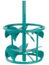
Anbefalet type piskeris: Collomix type DLX 152

Med en kraftig omrører (ca. 500–700 min -1 ) kræves der en blandingstid på ca. 2–3 min. Efter en modningstid på ca. 5 minutter skal massen grundigt homogeniseres endnu en gang.